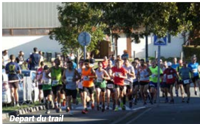
Départ du trail