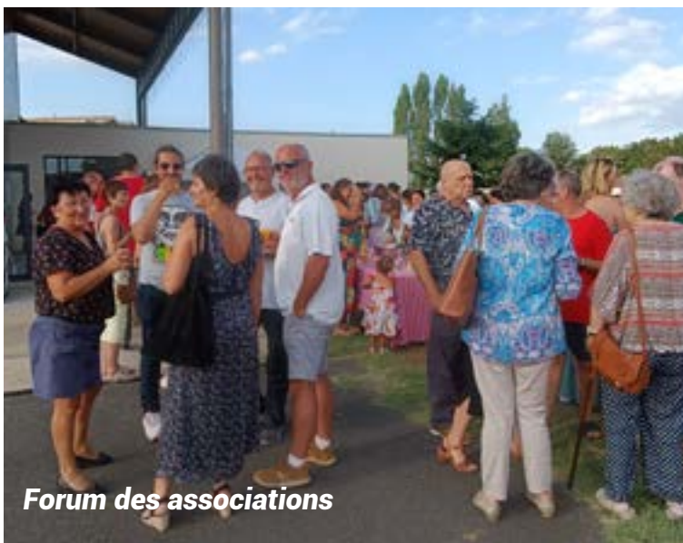
Forum des associations