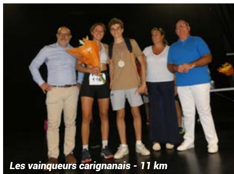
Les vainqueurs carignanais - 11 km