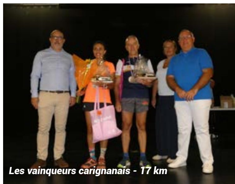
Les vainqueurs carignanais - 17 km