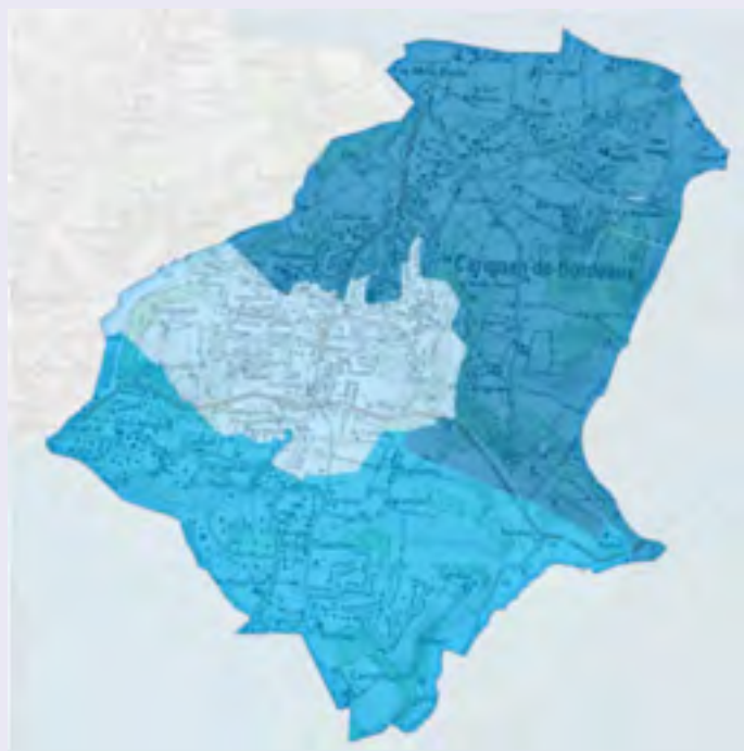
Carte prévisionnelle du déploiement

Pourcentage de la couverture du territoire